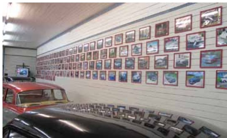
Veggene i bilhallen er dekorert med bilder av alle bilene i klubben. Bildene er nummererte, og en perm med bilder og info om alle bilene ligger for gjennomsyn for de av oss som måtte ønske mer informasjon.