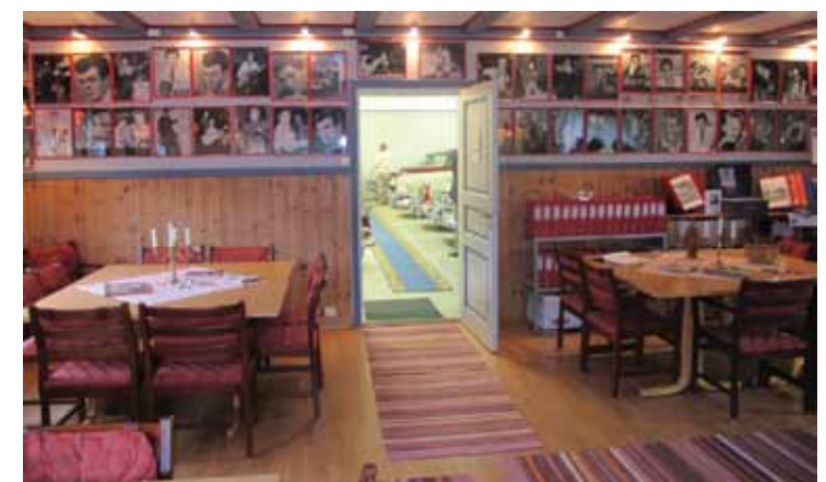
Forsamlingsrommet er dekorert med bilder av legendariske norske rockere. Jack Tveter er ikke bare lidenskapelig opptatt av bil, men vet også alt som er verdt å vite om norsk rock på femtitallet. Her kan man se på bilder og avisutklipp og høre smakebiter av musikken fra den tiden.