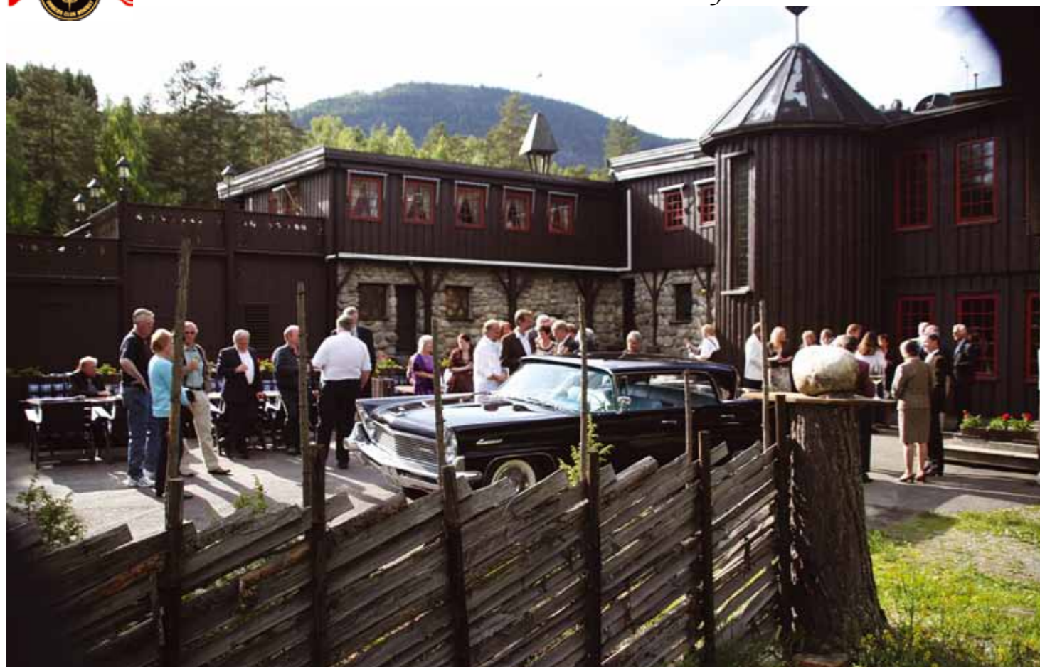
Fra området utenfor Kroa på Hunderfossen, rett før jubileumsmiddagen.

Lincoln & Continental Owners Club Norway