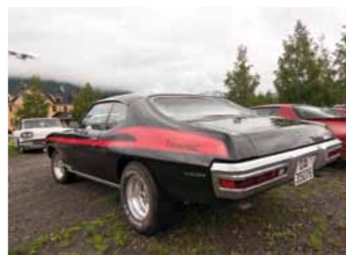
Svart '71 Le Mans eid av Morten Varpestuen fra Vinstra.