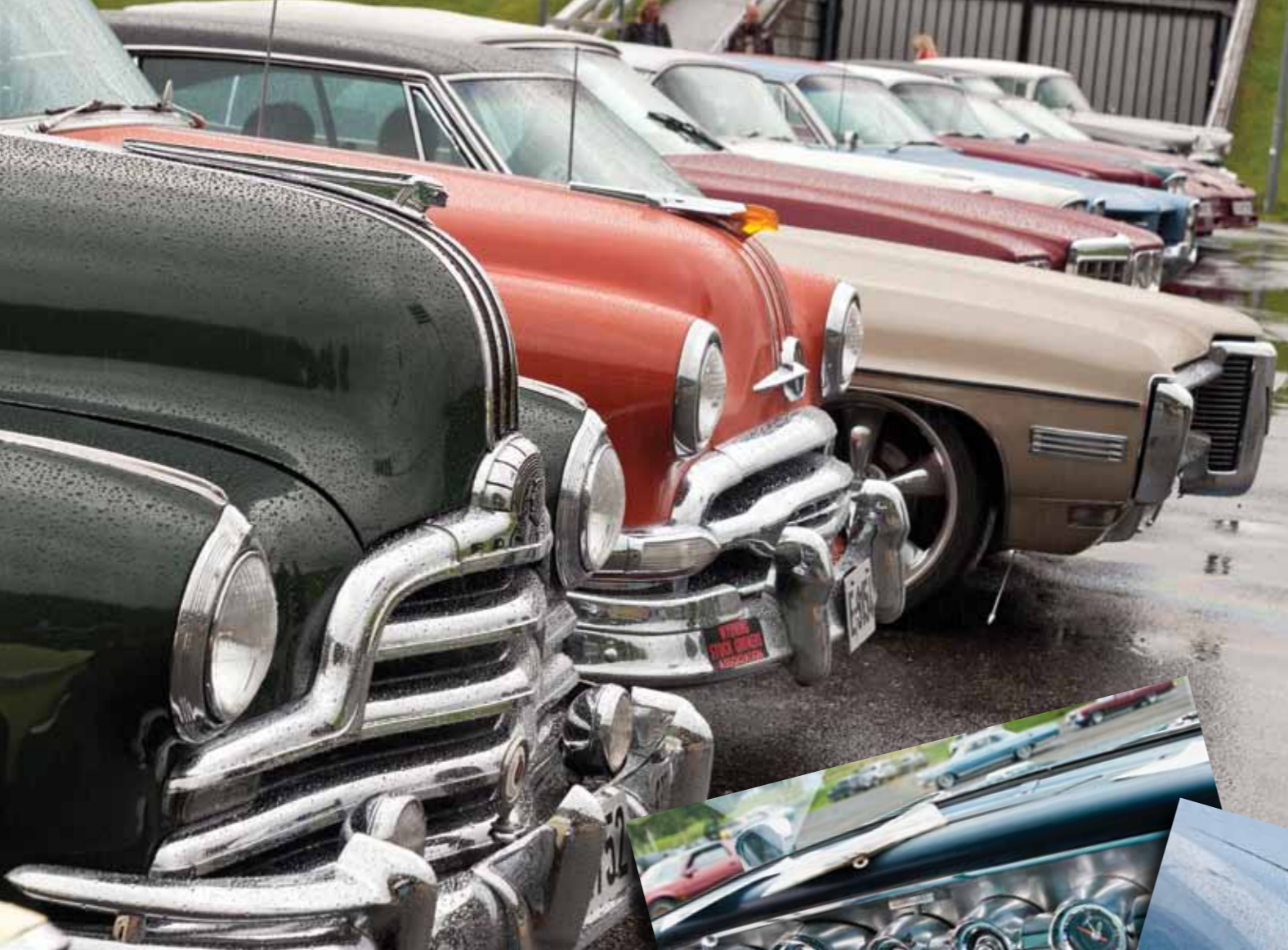
Pontiac har gjennom tidene klart å markere seg med spesielle og iøynefallende griller på sine biler. Her et utvalg fra 1947 og oppover til åttitallet.