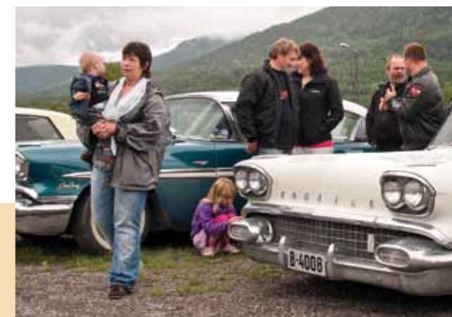
Små og store indianere på landstreiff.