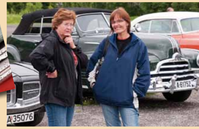
Om damene pratet bil vites ikke, men humøret var på topp.