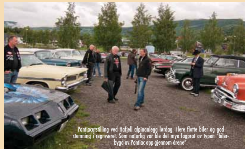
Pontiacutstilling ved Hafjell alpinanlegg lørdag. Flere flotte biler og god stemning i regnværet. Som naturlig var ble det mye fagprat av typen "biler-bygd-av-Pontiac-opp-gjennom-årene".