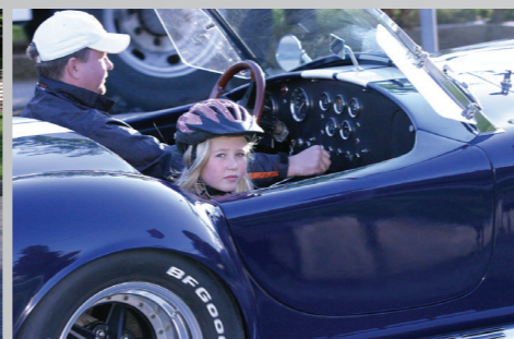
Better safe than sorry!