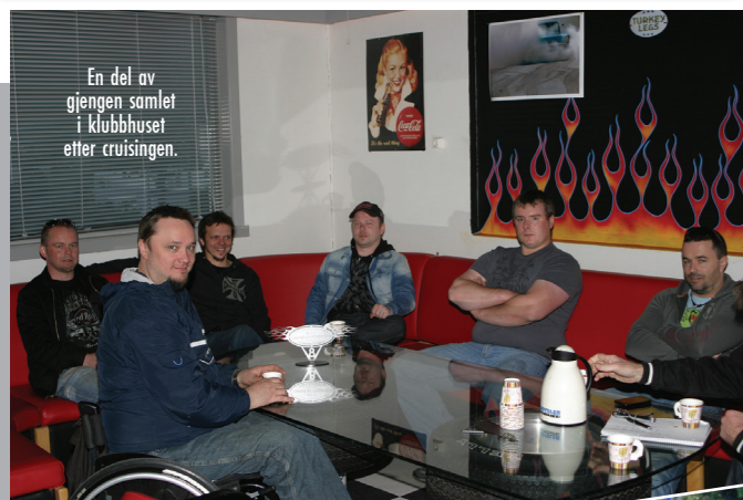
En del av gjengen samlet i klubbhuset etter cruisingen.