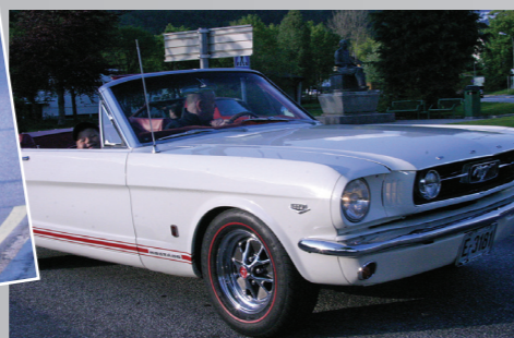
Kledelig fargekombinasjon på en '66 Mustang convertible. Hvit med rødt interior, røde GT-striper og red-line dekk. Eies av Andre Nilsvik.