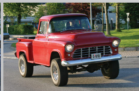
Litt over gjennomsnitt bakkeklaring på Tor A. Humberens's '56 Chevrolet 3100 4x4.