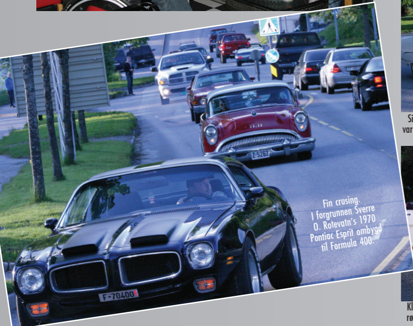
Fin cruising. I forgrunnen Sverre O. Rotevaln's 1970 Pontiac Spirit ombygd til Formula 400.