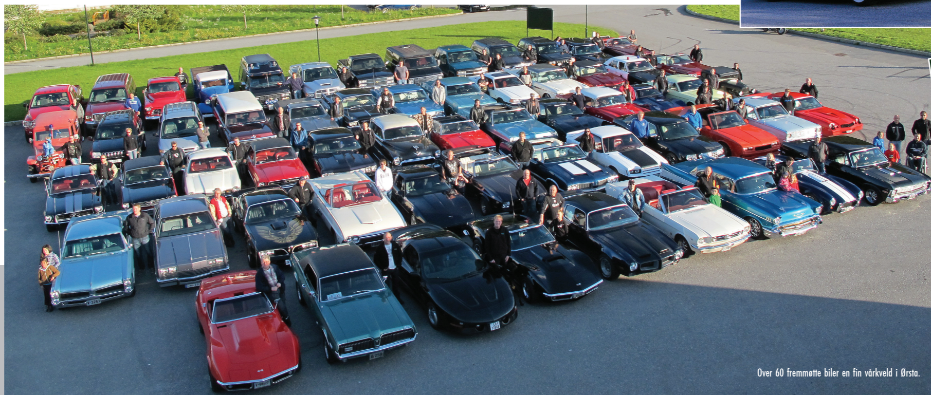
Over 60 fremmøtte biler en fin vårveld i Ørsta.