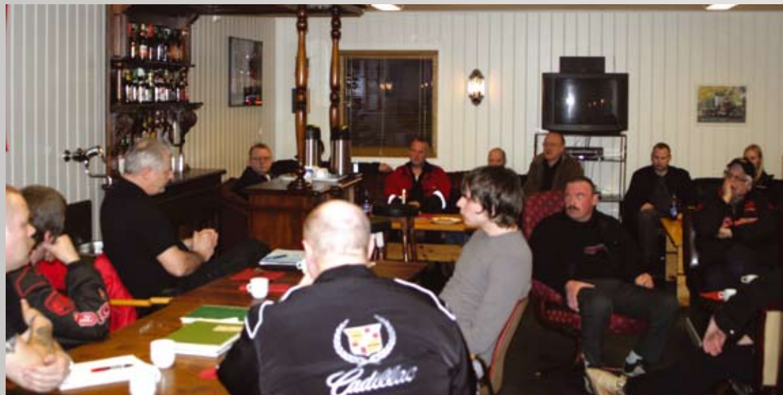
En lyttende forsamling i storstua hos AMCAR Sunndalsøra. Damene i klubben disket opp med vafler, sjokoladekaker og annet snadder.