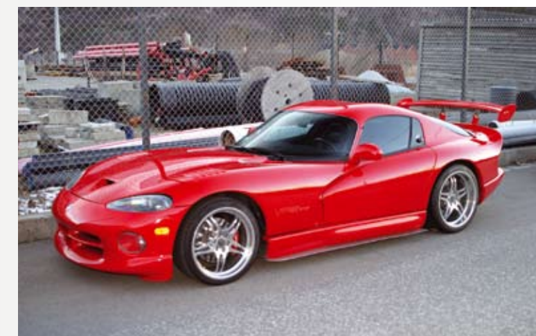
Mange av oss drømmer om det, men Per Moen har gjort noe med det. 1997 Dodge Viper GTS er bare knalltøft.