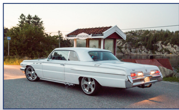
Eter at alle var dratt hjem til sitt og sine, tok undertegnede og klubbleder Rune Sortland en tur ut til Brandåsund. En tur over berg og sjo i en natur som truet med å ta pusten fra en traust innlandskar. Vi passet på å ta et bilde av Rune's 1962 Buick Le Sabre i lett customstil. Bilen eies i fellesskap med fru Trine A. Sortland.