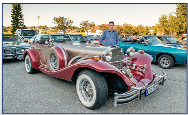
Dette er bil nummer 78 av totalt 93 biler som ble bygd i 1980 av merket Excalibur Phaeton Series IV. Bilen ble lagd på bestilling til en herre med navn Ronald Bircher fra Reno i Nevada. Eier av herligheten er Helge Harkerstad fra Rubbestadneset på Bømblo.