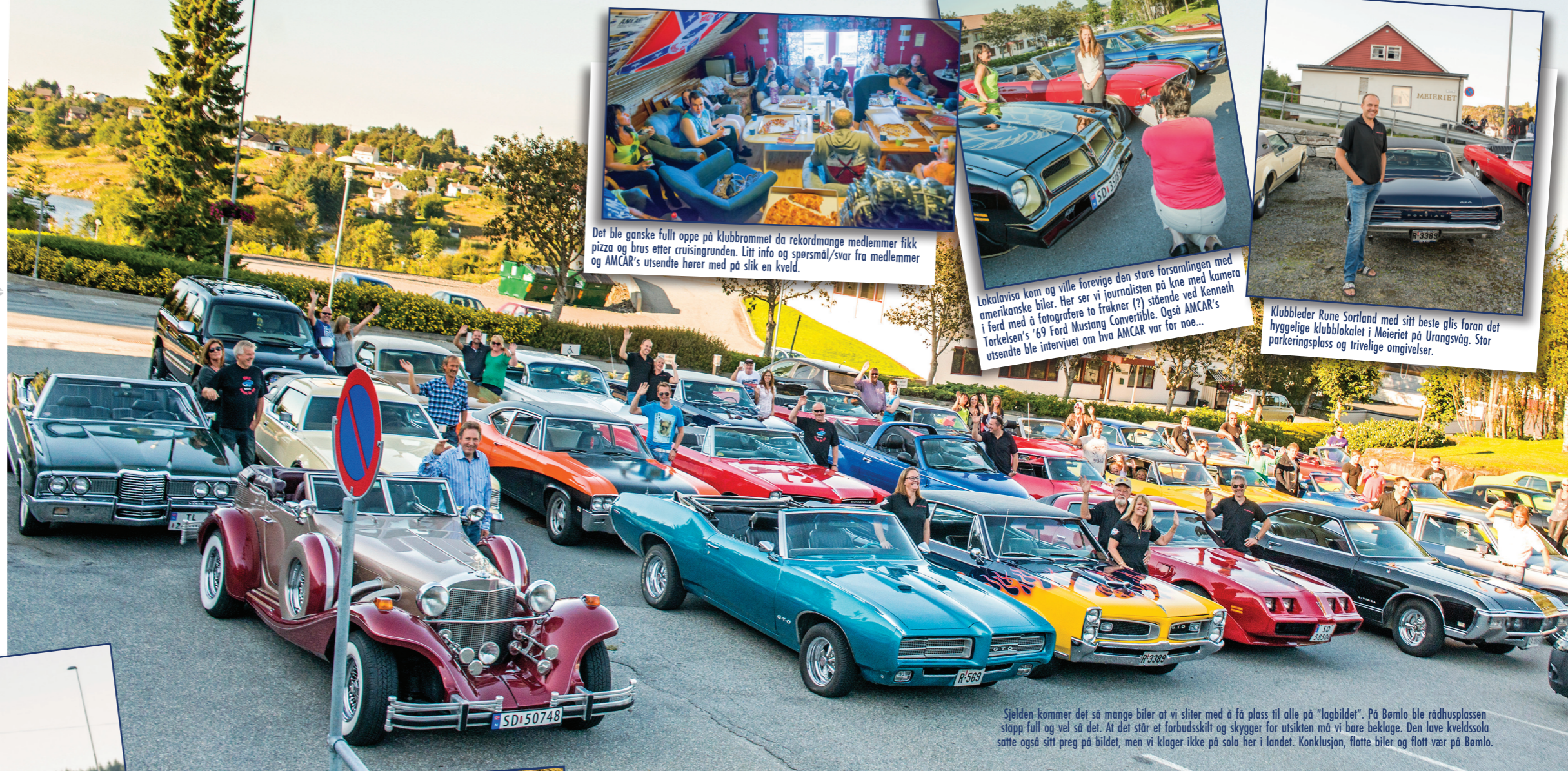
Det ble ganske fullt opp på Klubbrommet da rekordmange medlemmer fikk pizza og brus etter cruisingrunden. Litt info og spørsmål/svar fra medlemmer og AMCAR's utsendte hører med på slik en kveld.